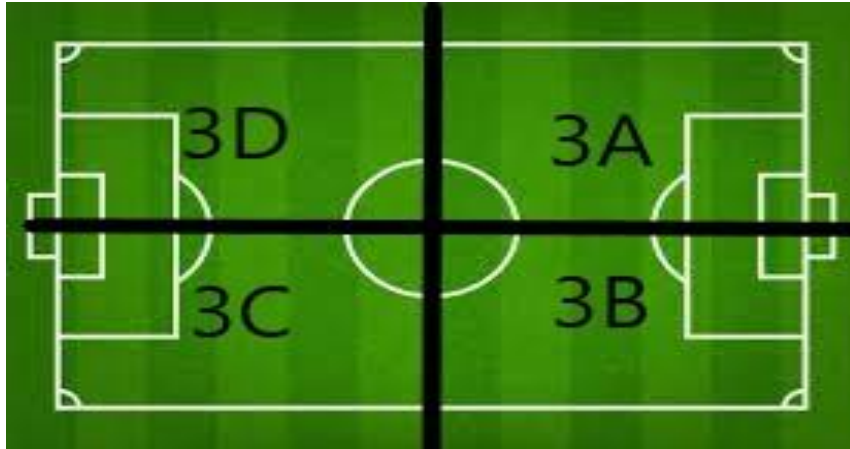
Veld 3 (Trainingsveld)